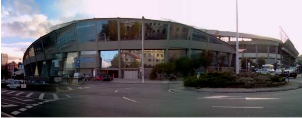
PALACIO DE LOS DEPORTES DE RIAZOR (A CORUÑA) -SPAIN Calle Manuel Murguía s/n 15011 A Coruña